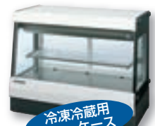
冷凍冷蔵用 ショーケース